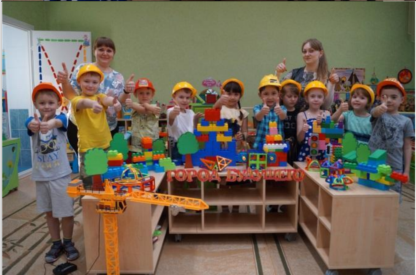
«Мама – инженер – строитель»