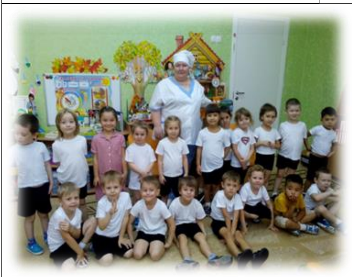
«Мама – повар-кондитер»