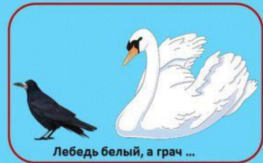
Лебедь белый, а грач ...