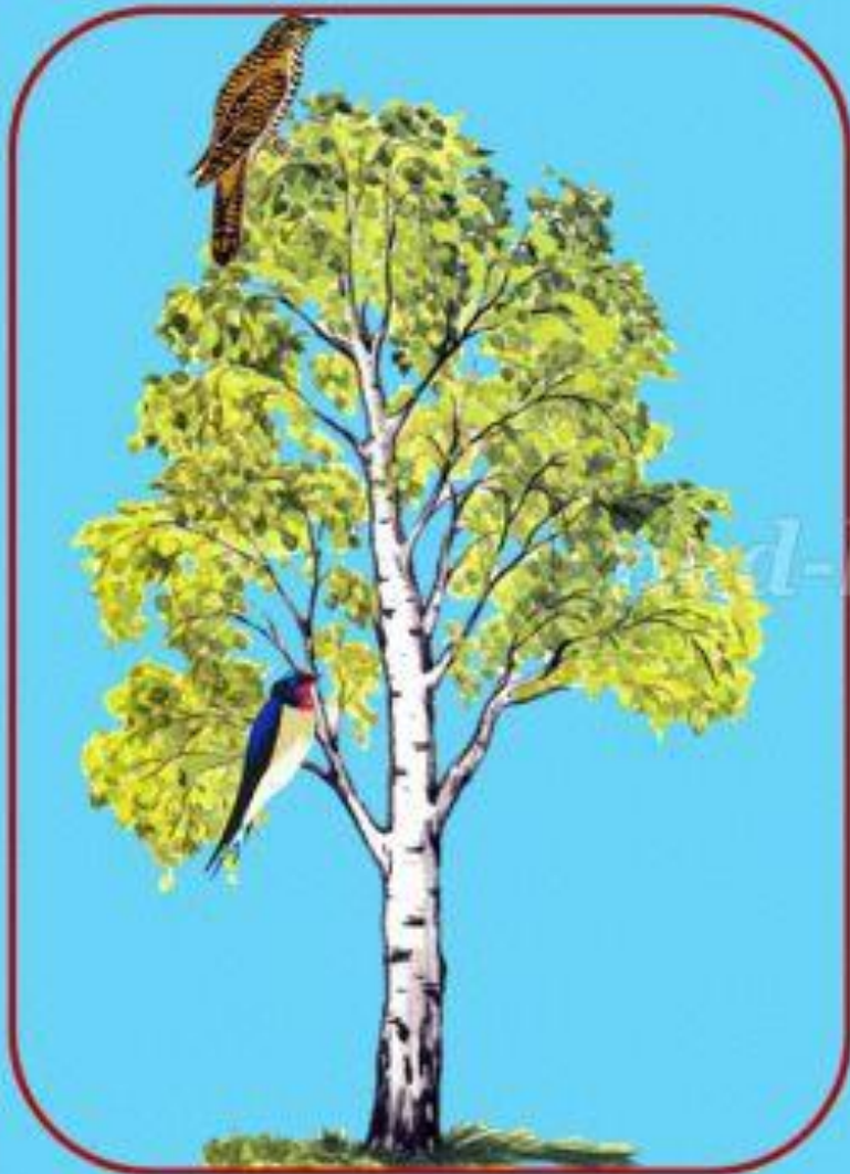
Кукушка сидит высоко, а ласточка ...