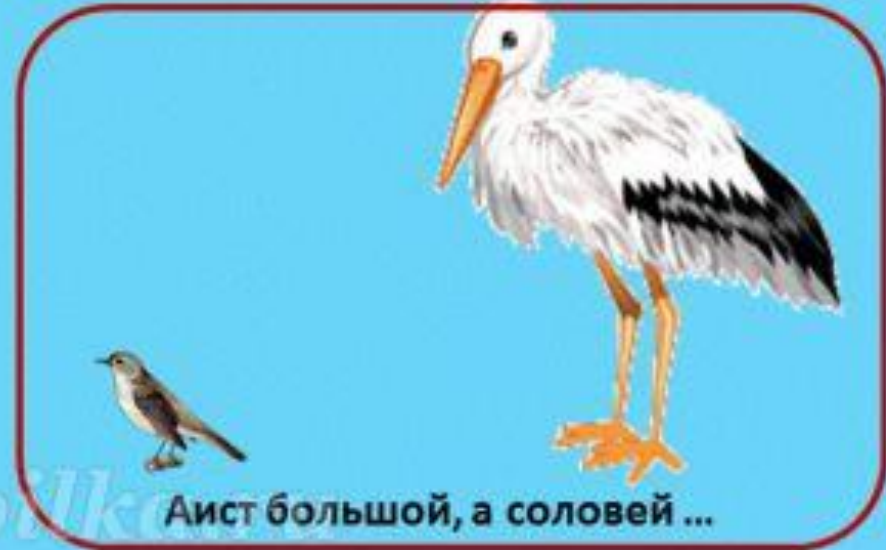
Аист большой, а соловей ...