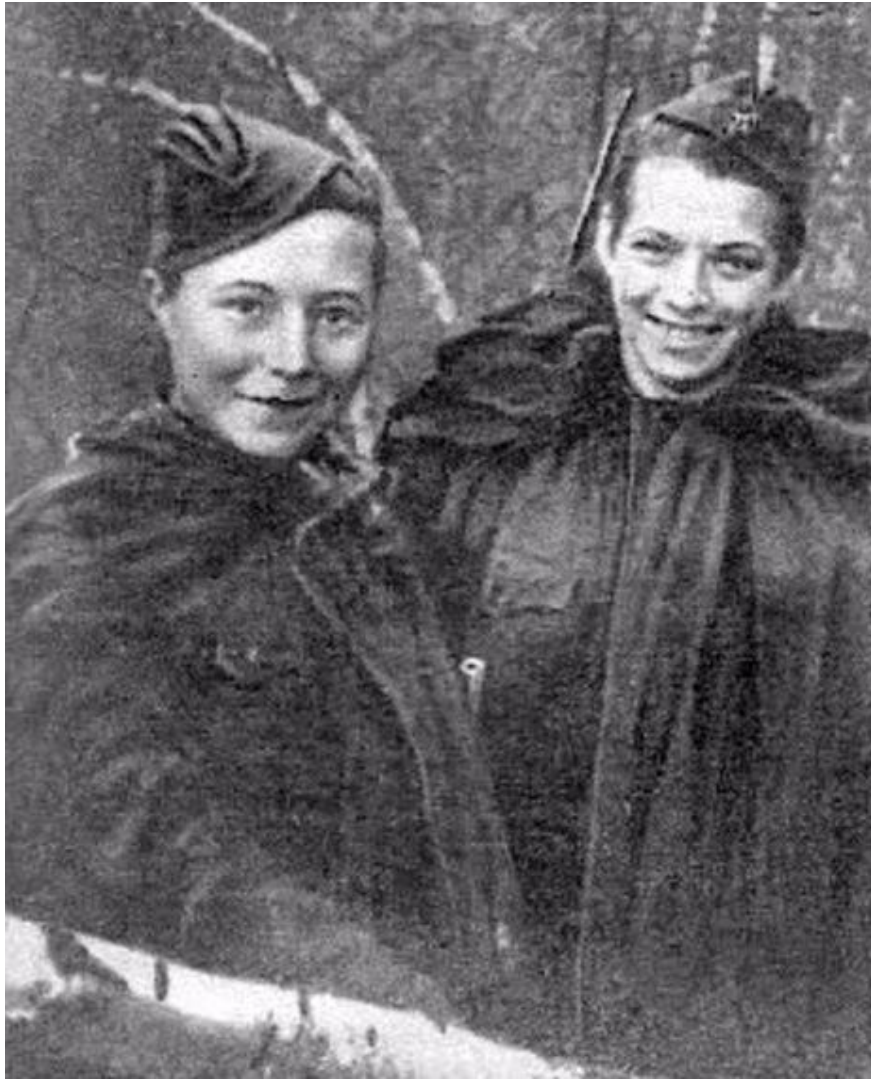
Снайперская пара: Н. В. Ковшова и М. С. Поливанова

В одном из своих писем к матери в ноябре 1941 года Наташа писала: "Любимая моя мама! Еще 20 октября мы приняли красную присягу. Ты подумай только: я, обыкновенная девушка, удостоена чести быть воином нашей Красной Армии, да еще вдобавок защищаю нашу Москву, нашу родную, горячо любимую, вечно молодую столицу. И знай, что во имя нашего счастья, во имя нашей большой и радостной победы я оправдаю это доверие Родины и отдам все, что могу, — свои силы, умение и жизнь, чтобы не пустить коричневую гадину к Москве, чтобы стереть ее с лица земли..."