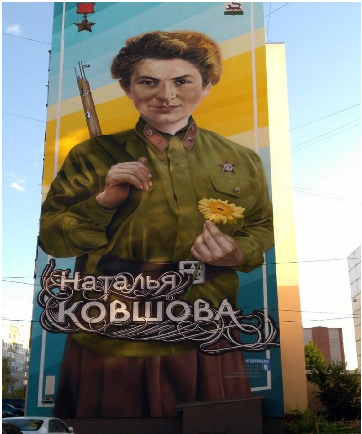
Стена дома в Уфе